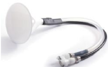
Embudo de llenado Ref. 279.531 - 1 ud.