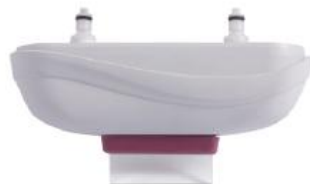
Cartucho fotodepilación Ref. 11.111 - 1 ud.