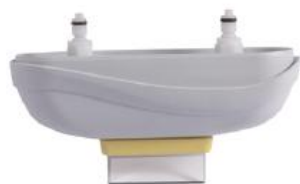
Cartucho fotorrejuvenecimiento Ref. 11.125 - 1 ud.