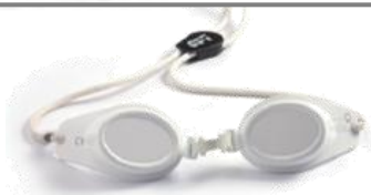
Gafas usuario opacas Ref. 61.457 - 1 ud.