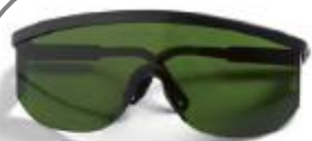
Gafas operador Ref. 11.020 - 1 ud.