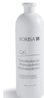
Gel fotodepilación Ref. 11.109 - 1 l.