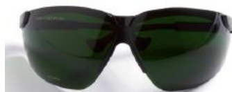
Gafas usuario Ref. 11.019 - 1 ud.