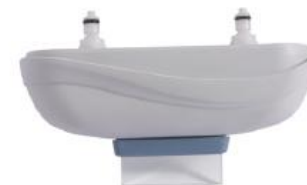
Cartucho acné Ref. 11.126 - 1 ud.